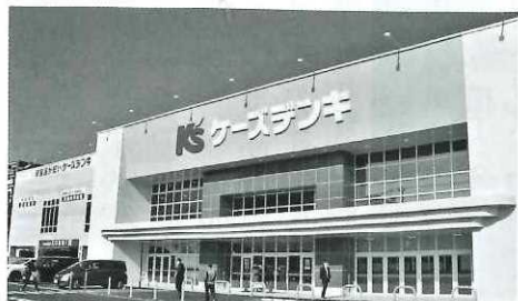
福岡都市圏での中核店舗に